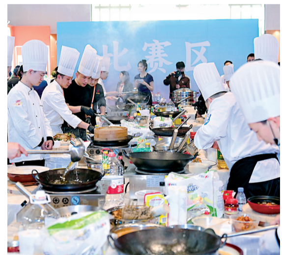
技能大赛现场,选手正在专心烹饪。

遗失声明 武汉市冰雪运动协会不慎将中国银行股份有限公司武汉武昌支行开户许可证遗失,核准号:J5210078532501,编号:5210-02397789。特此声明作废。