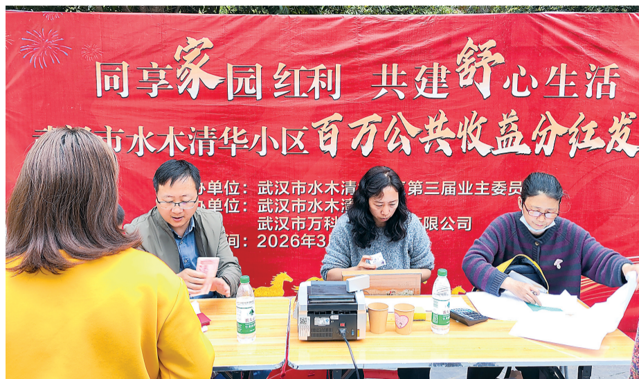
居民们排队领“分红”。