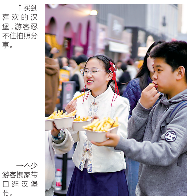
→不少游客携家带口逛汉堡节。

长江日报讯(记者江文斌 通讯员马威)近期,武汉与韩国交往热度持续攀升,文旅与经贸双向奔赴、热度不减。长江日报记者在东湖樱花园等赏樱景点看到,韩国旅游团的导游旗随处可见,不少韩国游客在接受记者采访时表示:“武汉樱花太美了,机票也便宜。”