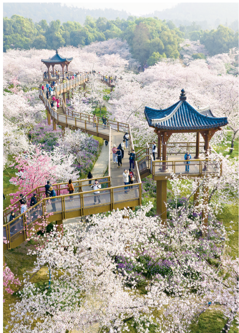
武汉东湖樱花园花海如云,景致如画。