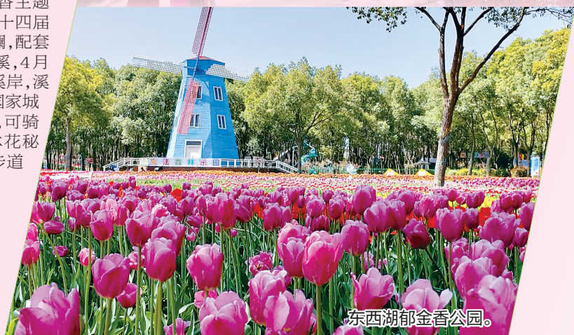
东西湖郁金香公园。

线路安排:首站乘坐地铁16号线,这条地铁线沌口至小军山段高架沿线,列车穿梭于金色花海,被誉为“开往春天的地铁”,是汉南赏花的标志性体验;第二站漫步汉南江堤长廊,油菜花与野花点缀岸坡,江风拂面,花香四溢;第三站汉南湘口街道,乡村油菜花海与白墙黛瓦农房相映,充满烟火气息,可品尝农家菜、体验采摘。