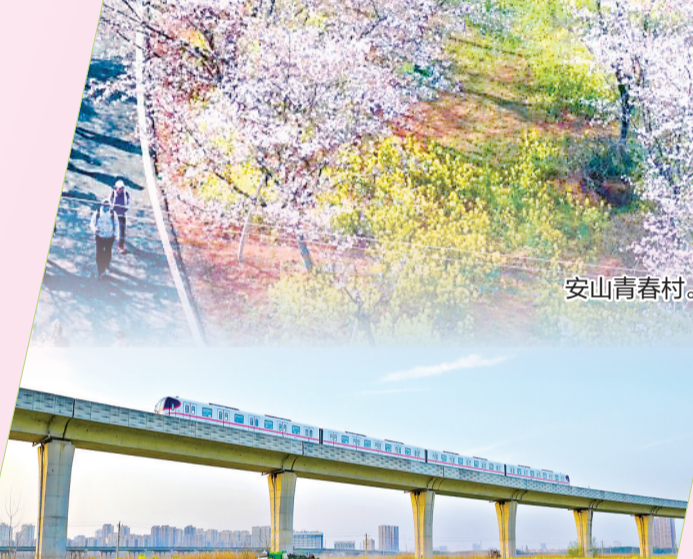
武汉地铁16号线穿梭于金色花海。

线路安排:首站东西湖郁金香主题公园,即日起至5月10日举办第十四届郁金香花展,七大主题区色彩斑斓,配有演出与市集活动;第二站樱花溪,4月上旬都是盛花期,粉白樱花缀满溪岸,溪水潺潺花瓣飘落;第三站金银湖国家城市湿地公园,绿道串联湖光花海,可骑行徒步;收尾站梧桐雨公园,“林花秘境”月季、杜鹃次第绽放,6公里步道适合漫步赏玩。