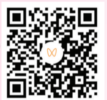
扫码了解“七大花路”