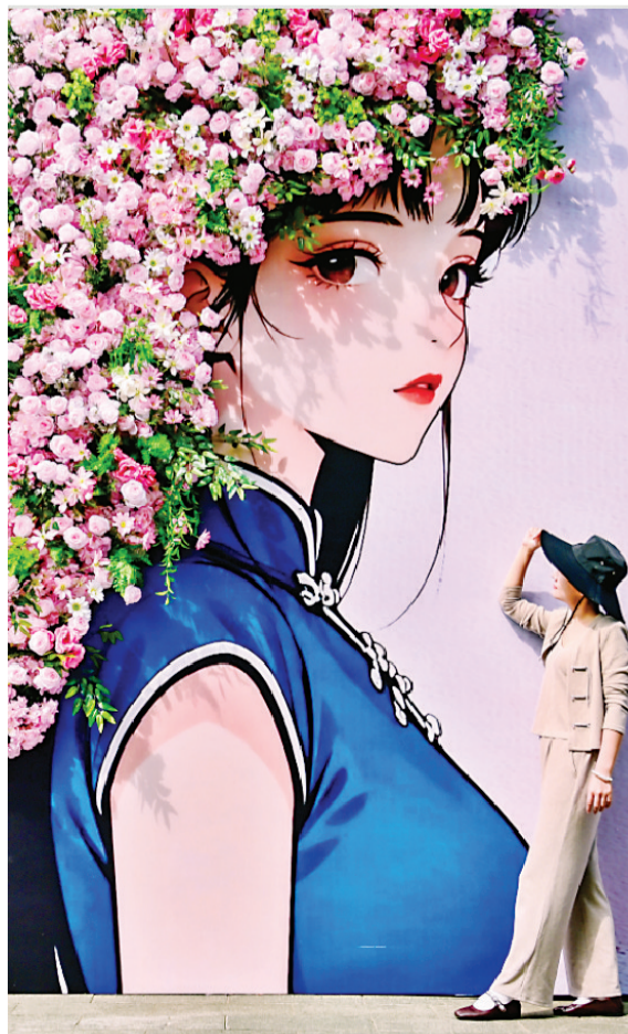
新洲区邾城街头的“簪花姑娘”。

市民赏花兴,农民增收旺。您的每一次出行,都是对武汉乡村最深情的支持,也是城乡融合、乡村振兴最生动的注脚。这个春天,让我们相约田野,在花海中遇见武汉最美的乡愁,共同谱写一曲属于春天的赞歌。