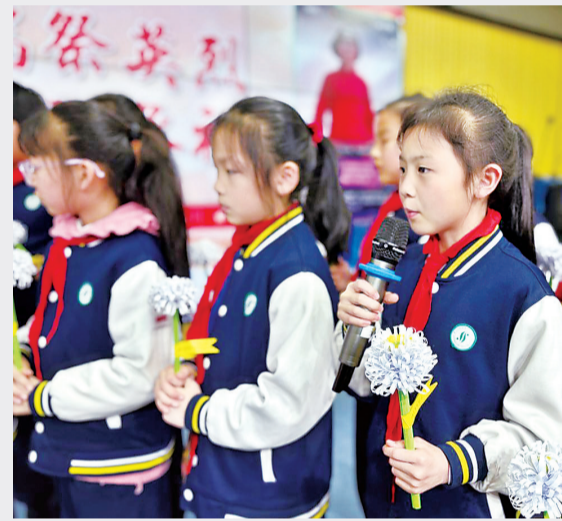
上图:青山区钢城第十一小学303班学生云端祭英烈。