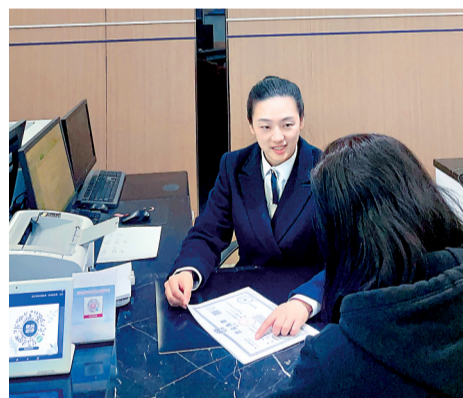
一家企业工作人员正在市民之家武汉商标窗口办理业务。