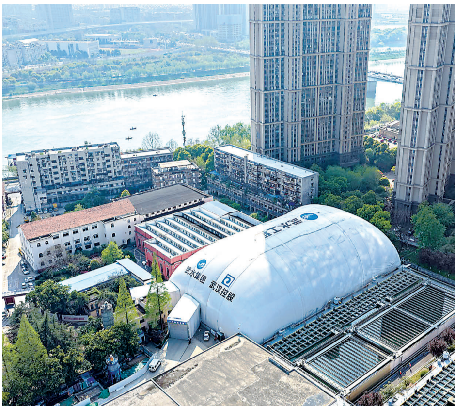
从空中俯瞰,宗关水厂基坑气膜如同一只巨大的白罩子。

对于首次启用基坑气膜这一决策,武汉控股公司相关负责人表示,隔绝施工污染,不仅保护汉江水源地生态,更是守护母亲河长江,为企业升级改造、绿色转型探出一条新路子。