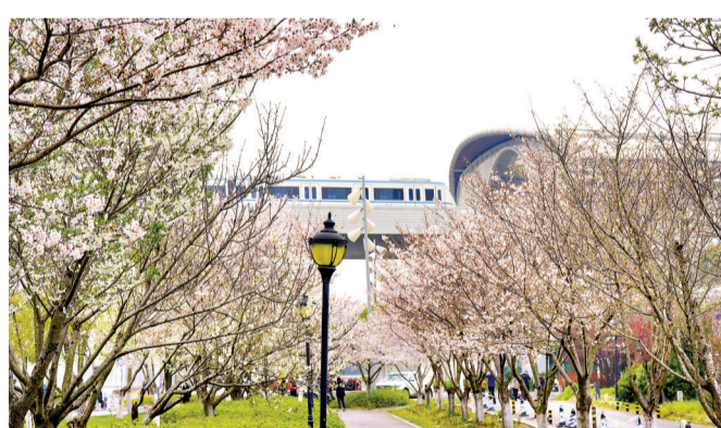
地铁1号线列车驶过樱花盛开的码头潭公园。