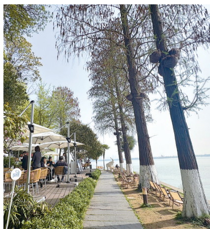
餐厅位于东湖听涛景区内。