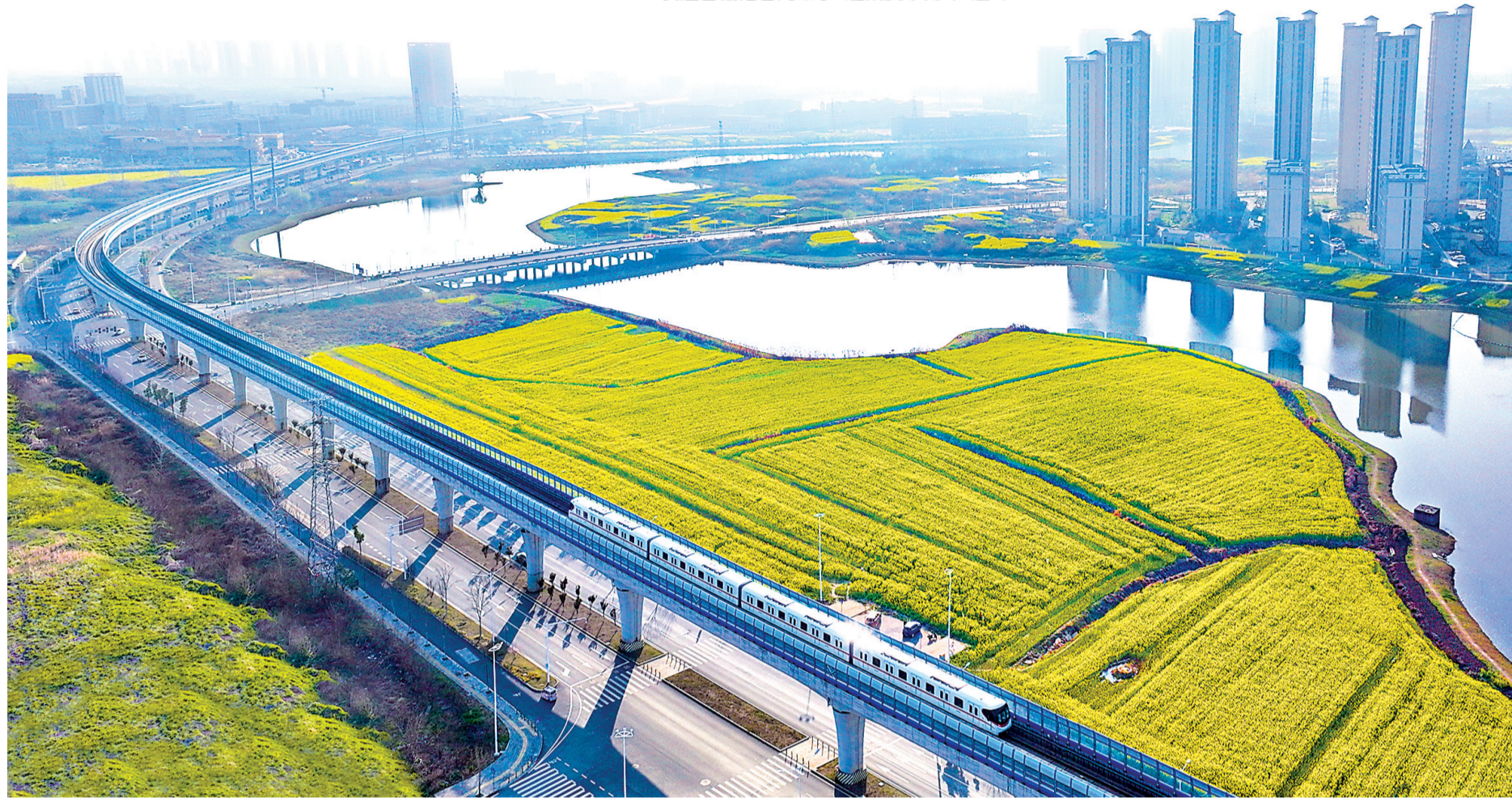
武汉地铁16号线沌口至小军山之间6.2公里的高架临江区段,迎来了春日最美景致。