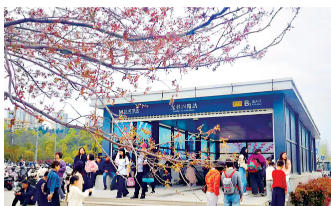
11号线光谷四路站B2口人流如织。