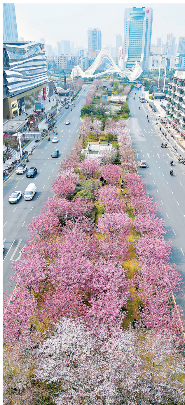
地铁2号线珞喻路站E出口外,市民游客赏花留影。