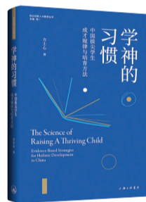
《学神的习惯:中国拔尖学生成才规律与培育方法》 方士心 著 上海三联书店

实际上,这种现象与个体的信息处理方式有关。工作记忆容量较高的人通常具备更强的多任务处理能力,能够同时关注和处理多个信息源。所以,正常情况下,工作记忆能力很强的孩子可以更快地处理和完成一道复杂任务。他们平时会显得很聪明,反应快,脑子活。然而,在“被盯着”的情境下,这种优势反而成为一种负担。他们会不由自主地分出一部分注意力资源去关注观察者的行为和