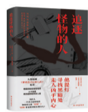
摘编自《追逐怪物的人》前言。

说到这里,似乎可以对“历史正剧”下一个定义了:叙事上“大事不虚小事不拘”,服化道认真考据,但最重要的仍然是主题、史观和价值取向!