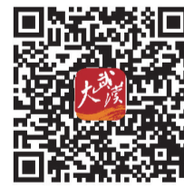
扫码查看 22个案例具体情况

修旧如旧工业遗址,打造以铁路文化IP为特色的城市活力公园,建成武汉前滩新青年活力聚场。