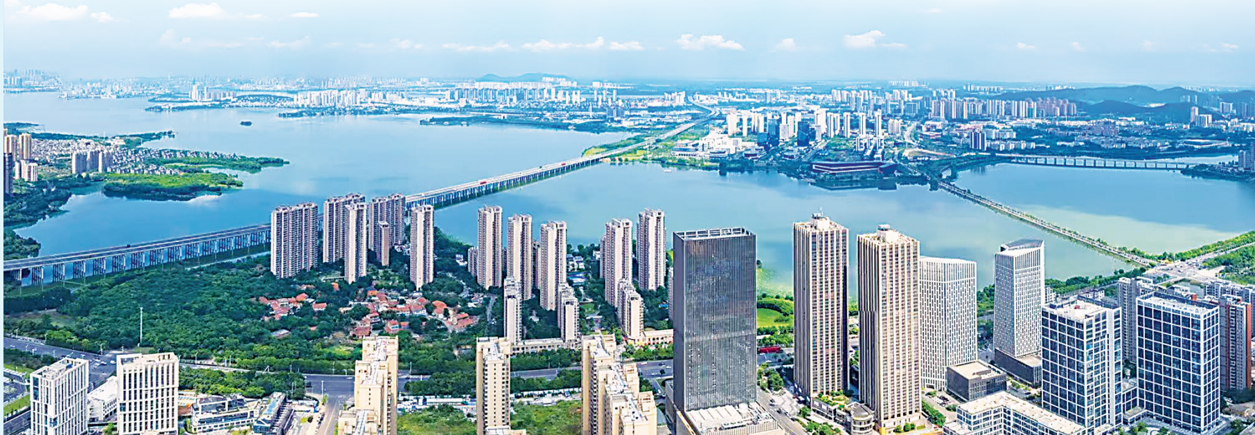
汤逊湖科技工作者社区片区,构建生产+生态+生活“三生融合”样板。