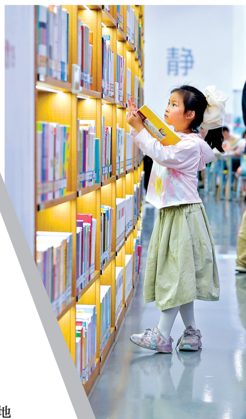
东西湖区图书馆,一名小学生正在寻找自己喜爱的读物。