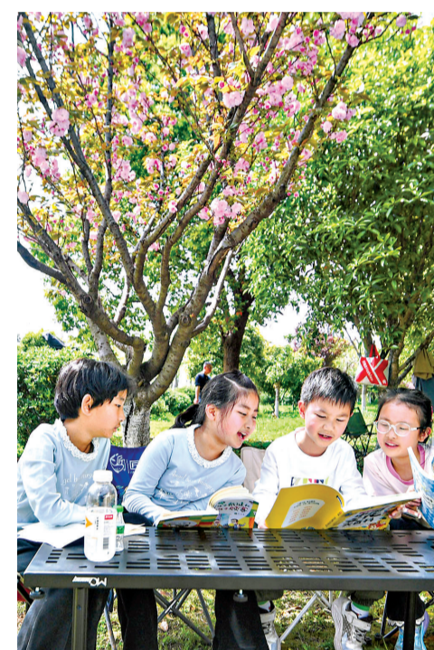
南太子湖公园里,几名小朋友在樱花树下愉快地阅读。