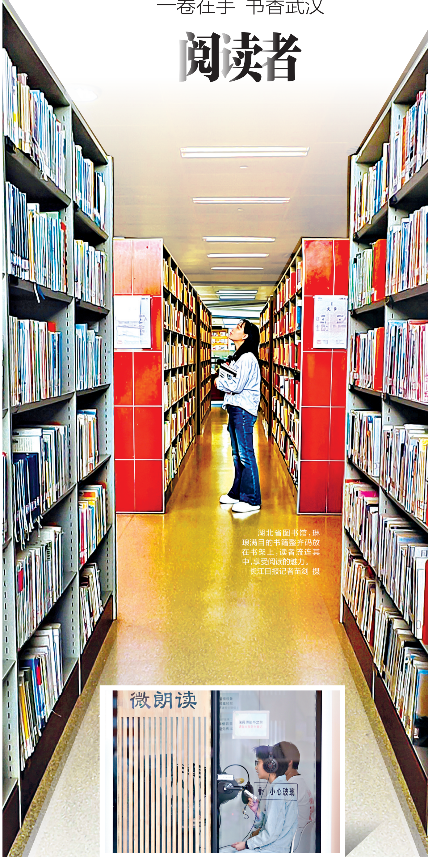
湖北省图书馆,琳琅满目的书籍整齐码放在书架上,读者流连其中,享受阅读的魅力。