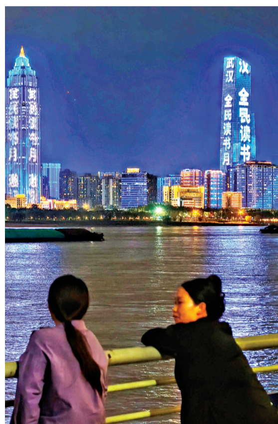
“书香武汉·全民读书月”主题灯光秀在两江四岸亮起,吸引不少市民驻足观看,营造浓厚书香氛围。