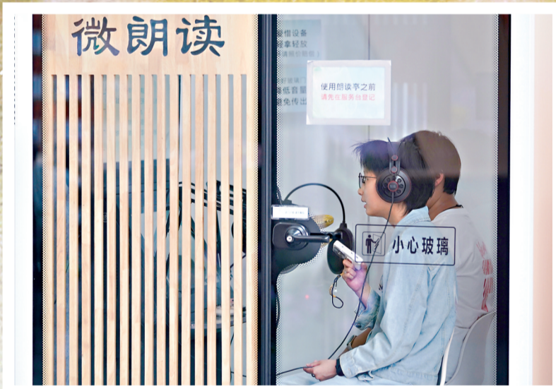
东西湖区图书馆,一位阅读者在朗读空间朗诵文章。

“下一站,金银潭……”地铁2号线上,不少乘客手中捧着书或电子阅读器。上班族秦明浩就是其中一员:“每天通勤要一个小时,以前刷手机,现在利用这段时间读书,一个月能看完三四本。”