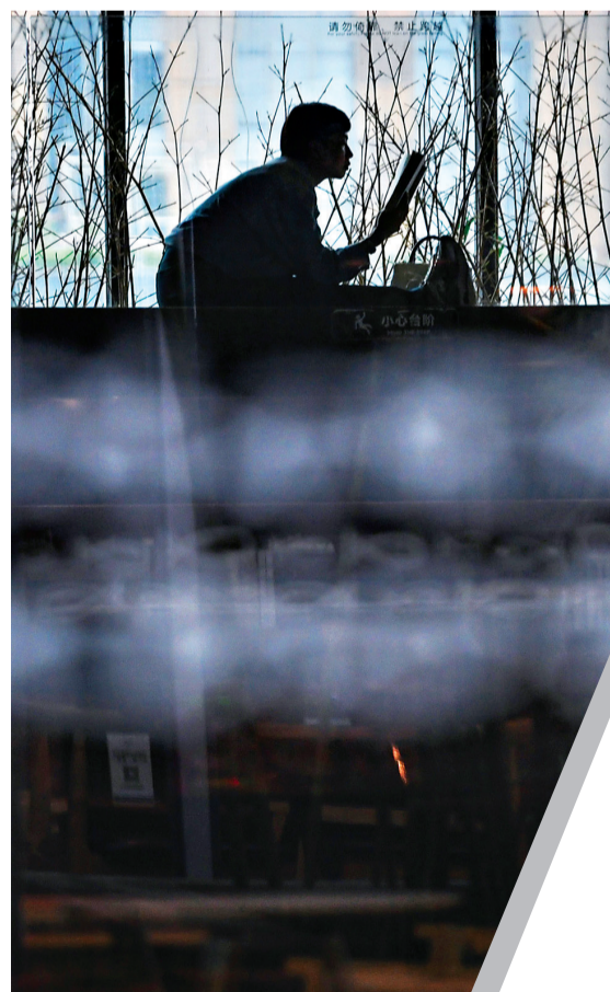
汉阳区龙阳大道的物外书店,一位忘我的阅读者。