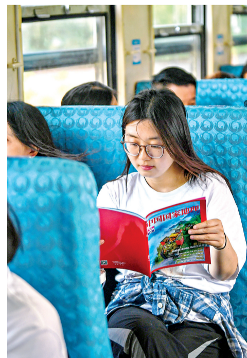
5856次普速环线列车上,一名乘客在安静地看书。