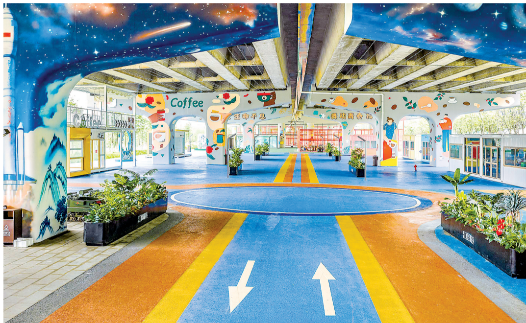
江夏印巷桥下“边角”变身“城市客厅”。