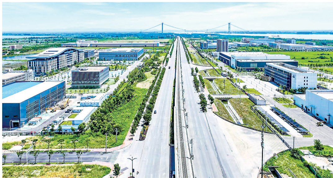
上图:新洲中国星谷。