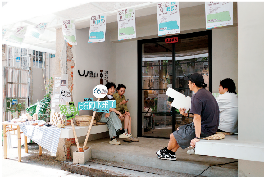
左图:微更新后的小刘家湾微山·66公园。