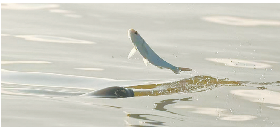
长江江豚在双柳“江豚湾”捕食小鱼。