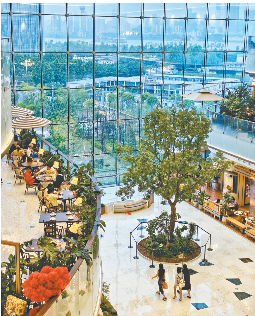
5月2日，市民和游客在武昌滨江天街逛街、购物、品美食，度过闲适假期。