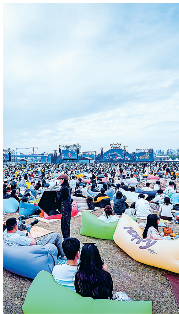
音乐节吸引了大量从外地专程赶来的年轻人。