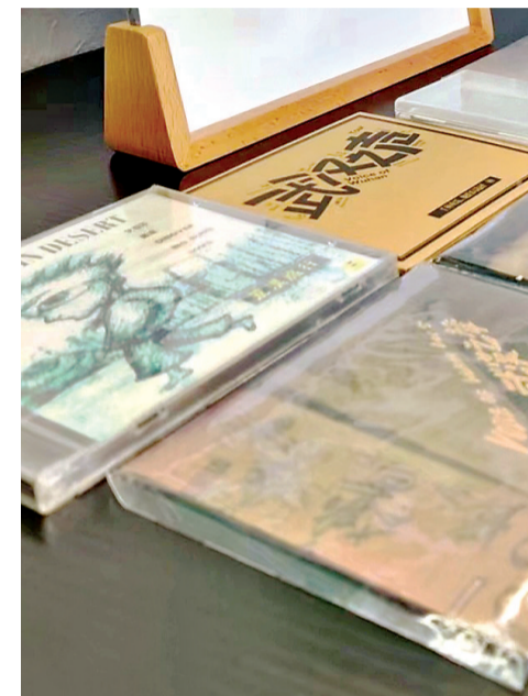
《武汉之声》音乐合辑已经出了12张。