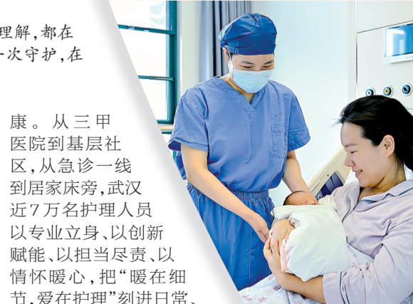
武汉儿童医院助产士陪伴产妇迎接新生命。