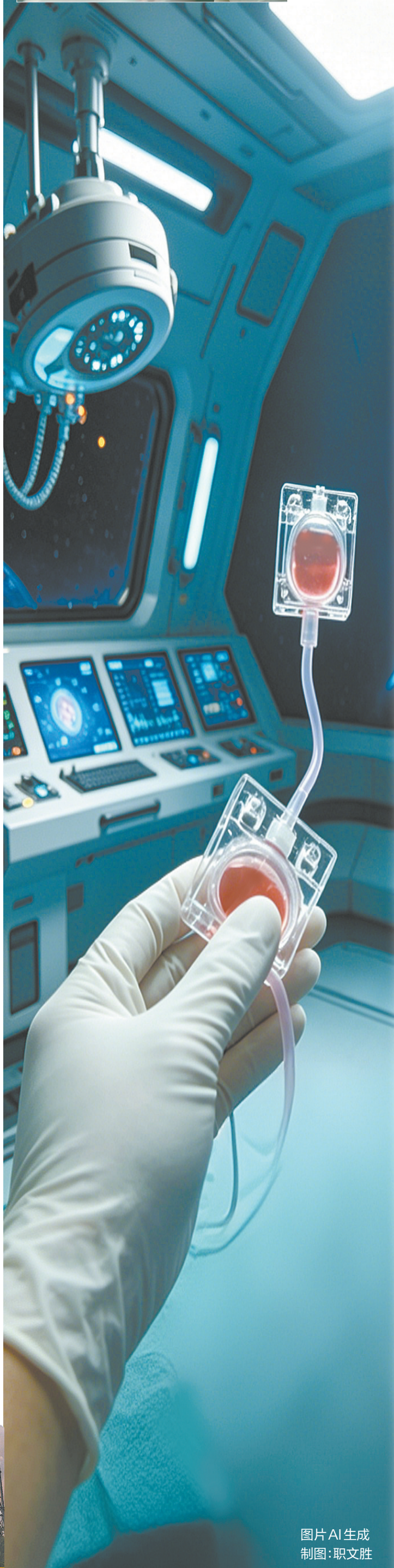
图片AI生成 制图:职文胜