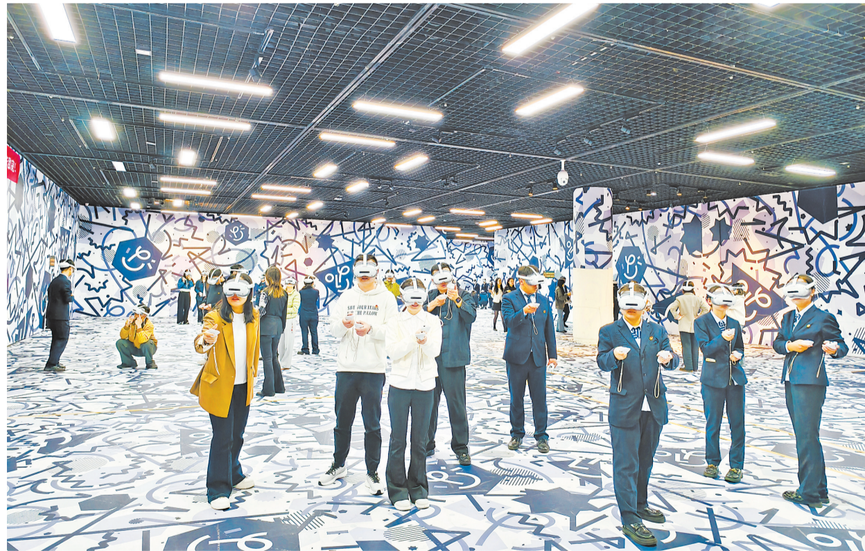
公司团建活动集体参与XR体验。

2026年“五一”假期前后，试运行期间的元宇宙博学空间迎来客流高峰，《伟大远征》与《穿越·汉阳兵工厂》两大XR沉浸式大空间项目成为武汉红色文旅的现象级项目。其中，《伟大远征》以红军长征为题材，是由“央博”中央广播电视总台数字文化艺术博物馆与北京新元知浪联合出品的多人协同XR大空间体验项目。2026年是红军长征胜利90周年，元宇宙博学空间聚焦党建、团建、研学三大需求，推出三类产品，实现一个研学空间、多重教育功能。