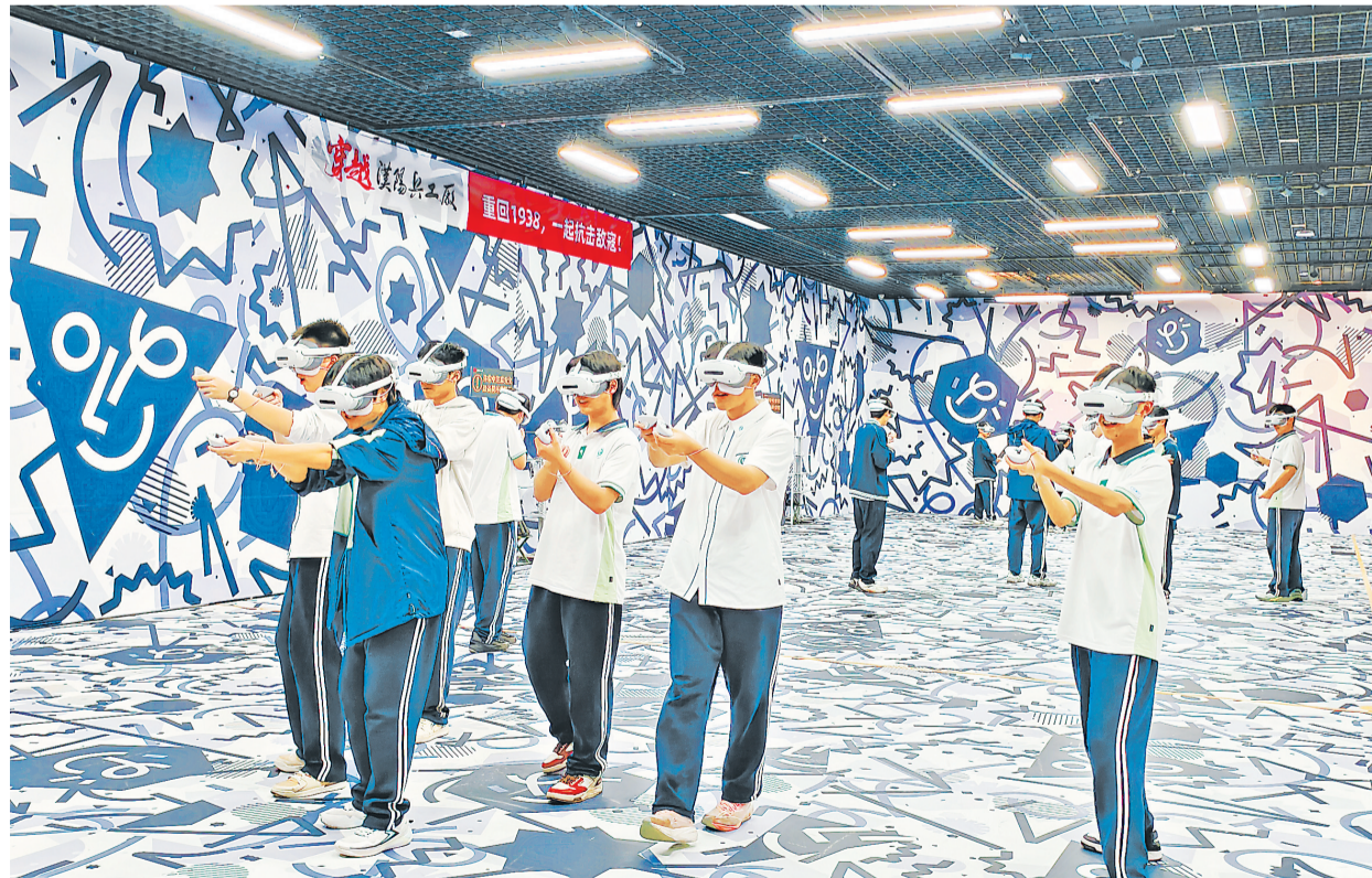
学生集体体验《伟大远征》。

博学空间还联合湖北省委党校定制课程《武汉英雄城市精神——穿越时空的解码》。湖北联合交通投资开发有限公司40名工作人员在聆听专题讲座后，在XR沉浸式体