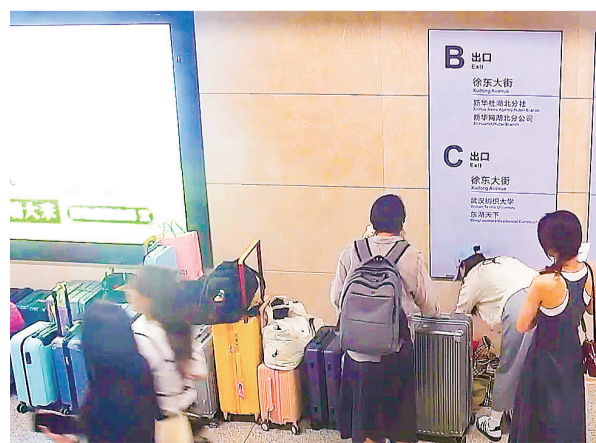
地铁梨园站，游客正在摆放行李箱。

不久前，武汉轨道交通的“无人行李箱墙”刷屏网络；一部遗落在武汉街边的手机被陌生人守护，引发全网点赞。