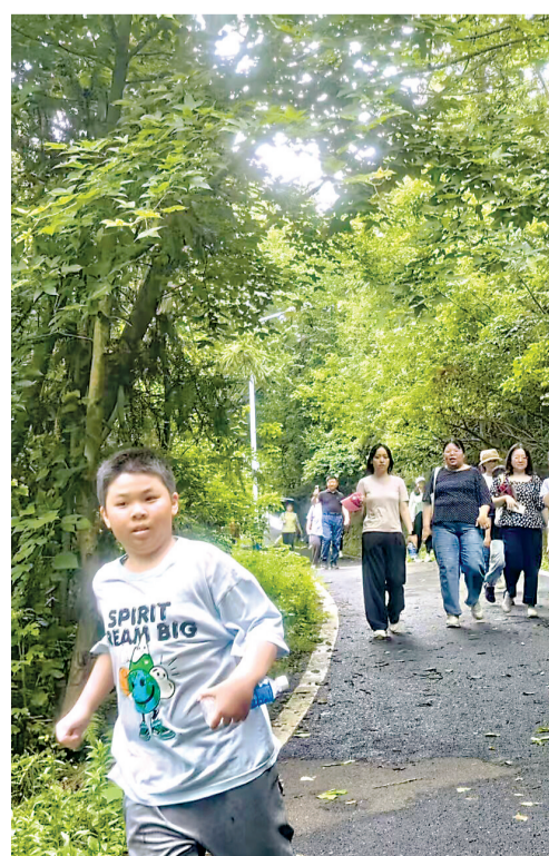
裕和夫子山景区游人如织。

据悉,在相关部门支持下,裕和夫子山居的蝶变还远远没有结束:总投资8000万元的城市更新项目,预计在明年8月份全面完工。二期项目将深入挖掘夫子山千年文脉,打造沉浸式古韵“青石古街”。未来这里将会形成“山体景观+古村风貌+田园综合体”的全能度假胜地。