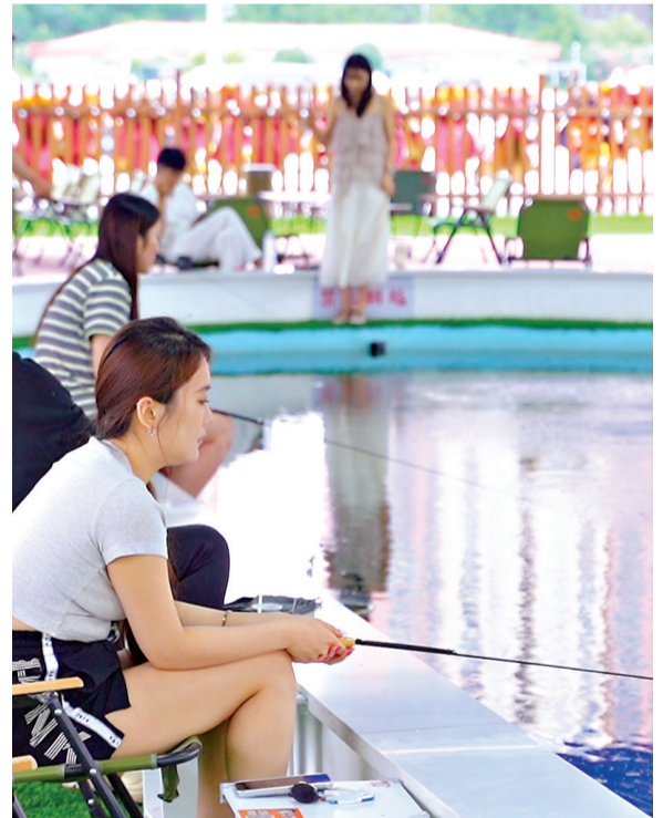
钓虾营地吸引许多市民前来钓虾。