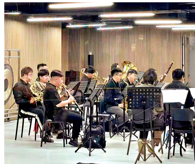
武昌区青年爱乐乐团正在黄鹤音乐谷排练。