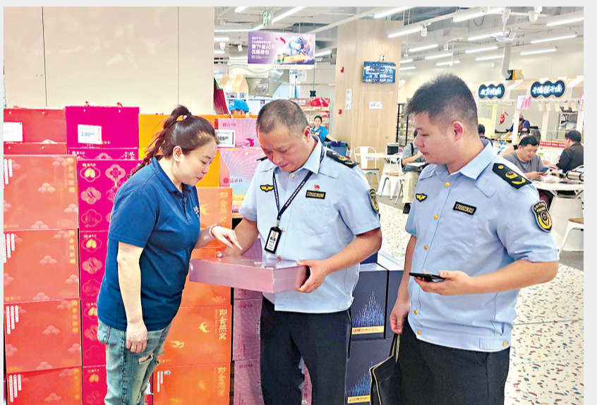
江汉区市场监管局工作人员检查“储信安”入驻商户的商品价格和质量。