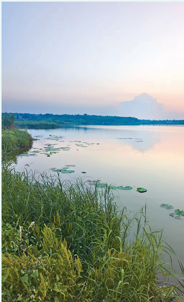
6月9日，新洲区牌楼村这片曾在武汉农交所平台挂牌交易中引发激烈竞争的鱼塘，此刻显得宁静而秀美。