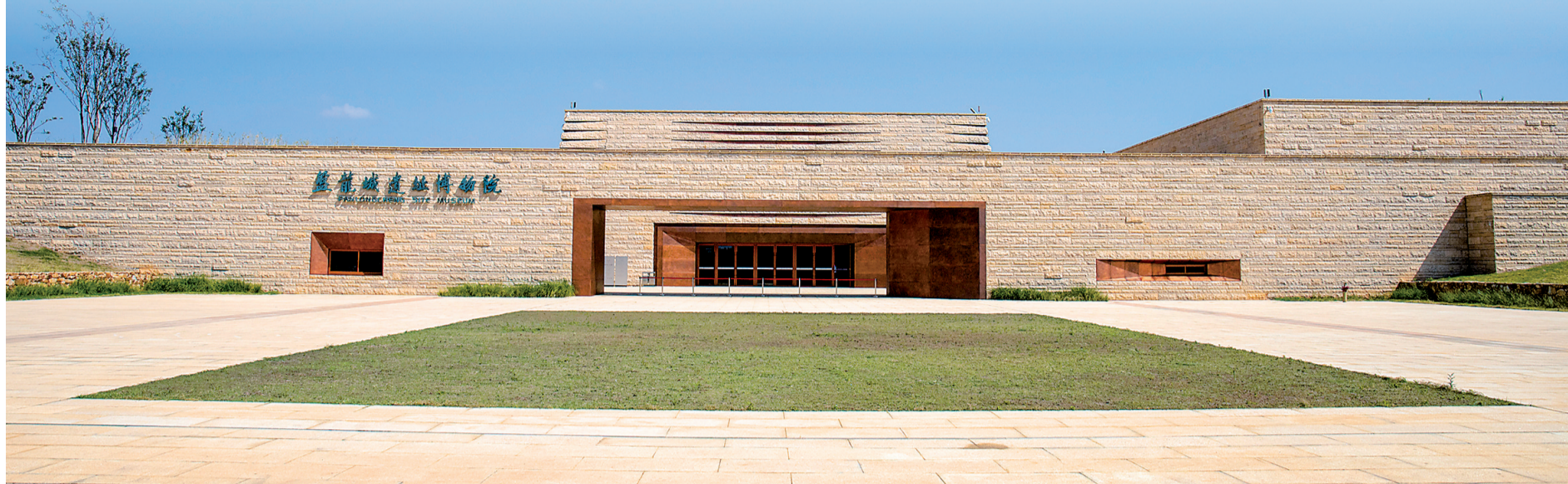
盘龙城遗址博物院。

武汉，依江而兴、文脉绵延，3500年建城史镌刻着荆楚文化的深厚底蕴，留存下中华文明的璀璨瑰宝。作为国家历史文化名城，武汉现有323处市级以上文物保护单位、131家博物馆，各类文化遗产星罗棋布，串联起城市的根与魂。