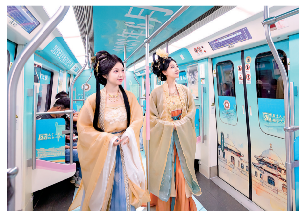
文物主题专列驶入武汉地铁2号线。