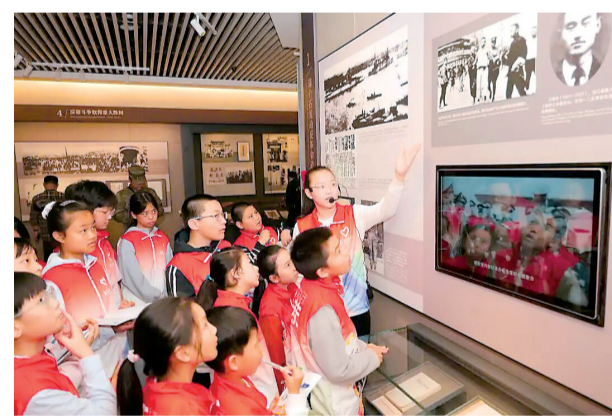
武汉革命博物馆“红巷苗苗”志愿讲解者。