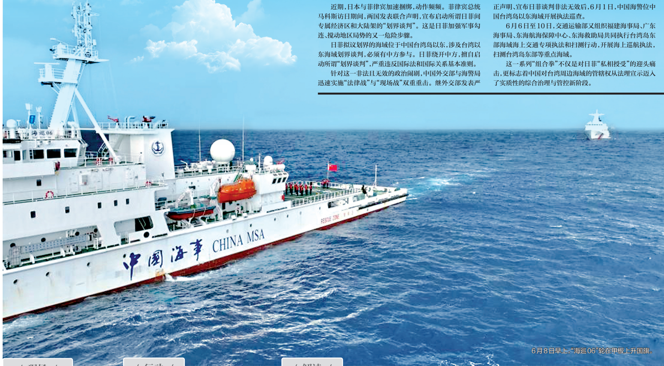
6月8日早上,“海巡06”轮在甲板上升国旗。

这一系列“组合拳”不仅是对日菲“私相授受”的迎头痛击,更标志着中国对台湾周边海域的管辖权从法理宣示迈入了实质性的综合治理与管控新阶段。