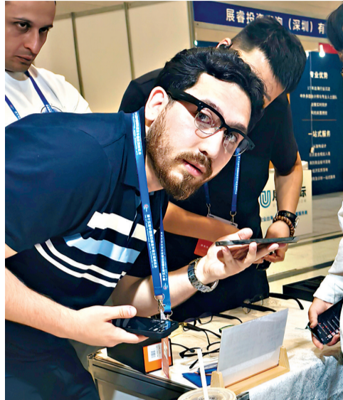
海外参展嘉宾体验AI眼镜。

多款细分赛道的人工智能新品同样圈粉。心智未来的智能戒指凭借时尚的外表“出圈”,它不仅可实时监测人体心率、血氧、睡眠健康数据,还集成交通刷卡NFC功能,已远销欧美市场;武汉植物方舟水培智慧种植设备,具备智能调光、水肥自循环核心技术,适配中东干旱地区农业种植,企业希望依托服博会平台,抢抓出海机遇;源之宇宙的“亩包”剧本生成系统,可一键生成城市文旅剧本、手绘文旅地图,契合当下文化市场的需求,收获多国文旅行业从业者关注。一众新潮实用的数智成果,精准贴合全球数字化转型需求,成为服博会亮眼看点。