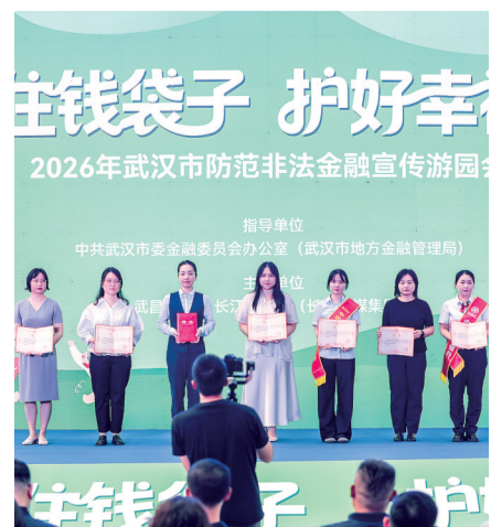
为“防非轻骑兵”颁发聘书。