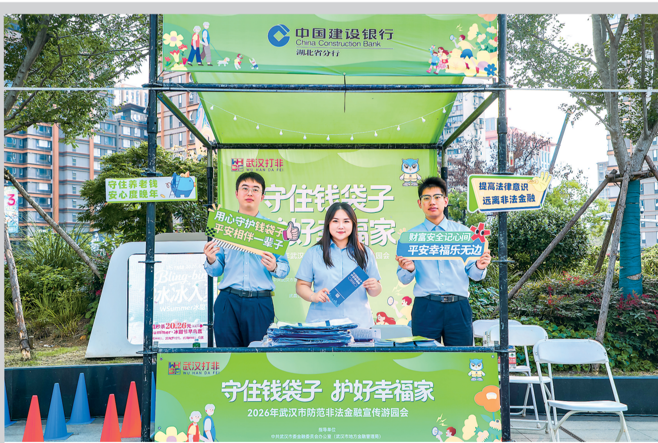
建设银行湖北省分行参加2026年武汉市防范非法金融宣传游园会。

建设银行湖北省分行深入贯彻党中央、国务院决策部署，认真落实省委省政府、监管部门和建行总行关于防范和处置非法金融相关工作要求，深刻领会防非打非工作的重要性与紧迫性，致力于保护广大民众财产安全，在全省范围内持续开展一系列形式多样的防非宣传教育活动，积极营造全民防非打非的良好氛围。