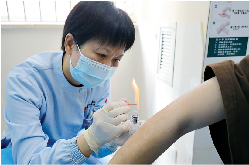
目前，皮肤科已开展火针、药线点灸、中药倒模、耳穴压豆等41种中医适宜技术。