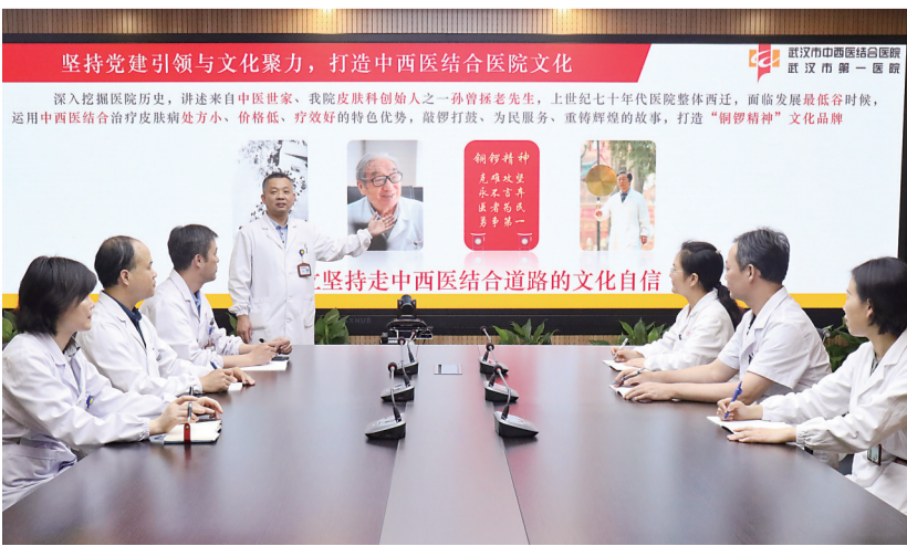
武汉市第一医院皮肤科践行“铜锣精神”，坚持走中西医结合道路。