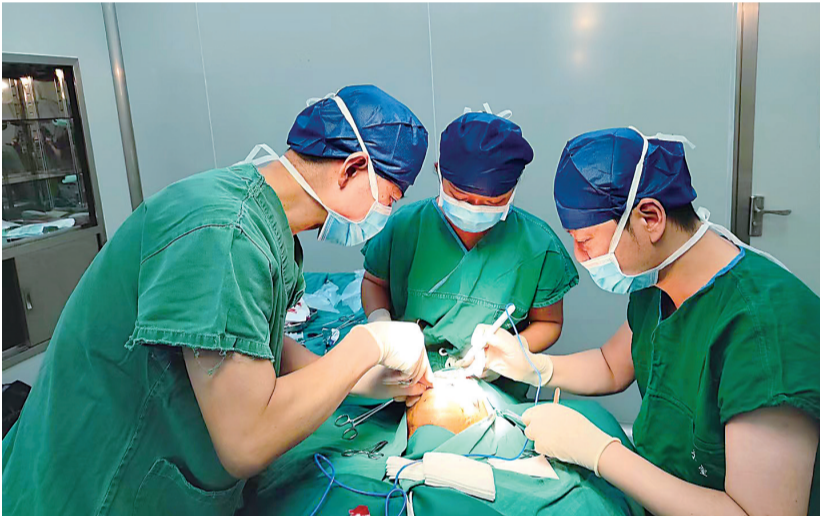
皮肤外科团队正在为患者做高难度四级手术。

据介绍，武汉市第一医院皮肤科已形成覆盖皮肤科内、外科、中西医结合及微创介入的完整诊疗体系，承担着全省重症、疑难及复杂皮肤病的核心救治任务。科室还牵头建成湖北省首家皮肤罕见病门诊，搭建起从筛查、诊断到随访、遗传咨询的全流程规范化诊疗体系，覆盖国家罕见病目录中8种遗传性皮肤病及50%以上合并皮肤损害的罕见病，填补了湖北省皮肤罕见病专科诊疗的空白。