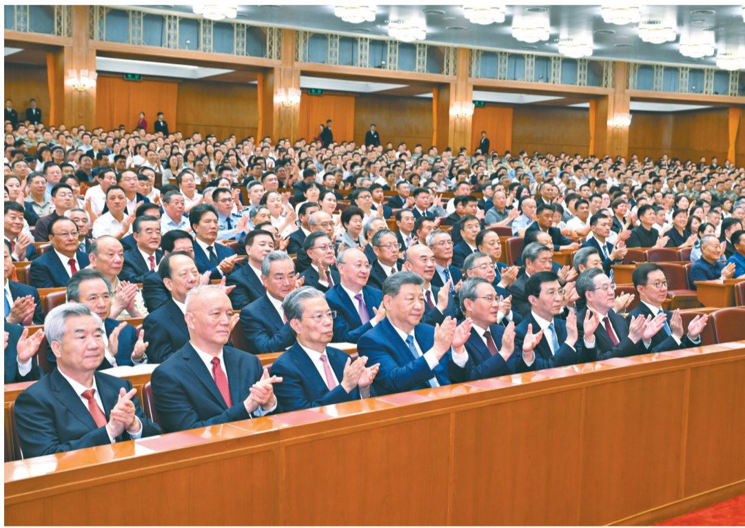
六月二十九日晚,庆祝中国共产党成立105周年音乐会《人民至上》在北京举行。习近平、李强、赵乐际、王沪宁、蔡奇、丁薛祥、李希、韩正等党和国家领导人,同约三千名观众一起观看演出。

观看音乐会的还有:中央党政军群各部门和北京市主要负责同志,各民主党派中央、全国工商联负责人和无党派人士代表,功勋荣誉表彰获得者代表,老党员、老干部代表,在华工作的外国专家代表,首都基层党员和各界群众代表,驻京部队官兵代表等。