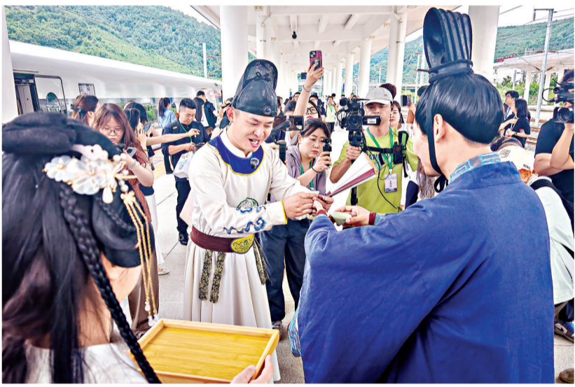
“李白”(左)与“尹吉甫”在十堰东站相遇。

西十高铁开通,武汉至西安压缩至3小时内。这条穿越秦岭的钢铁巨龙,不只改写了鄂陕时空距离,古时秦楚古道今朝化为秦楚文化旅游走廊,重新定义武汉“周末游”的客源半径与市场格局。