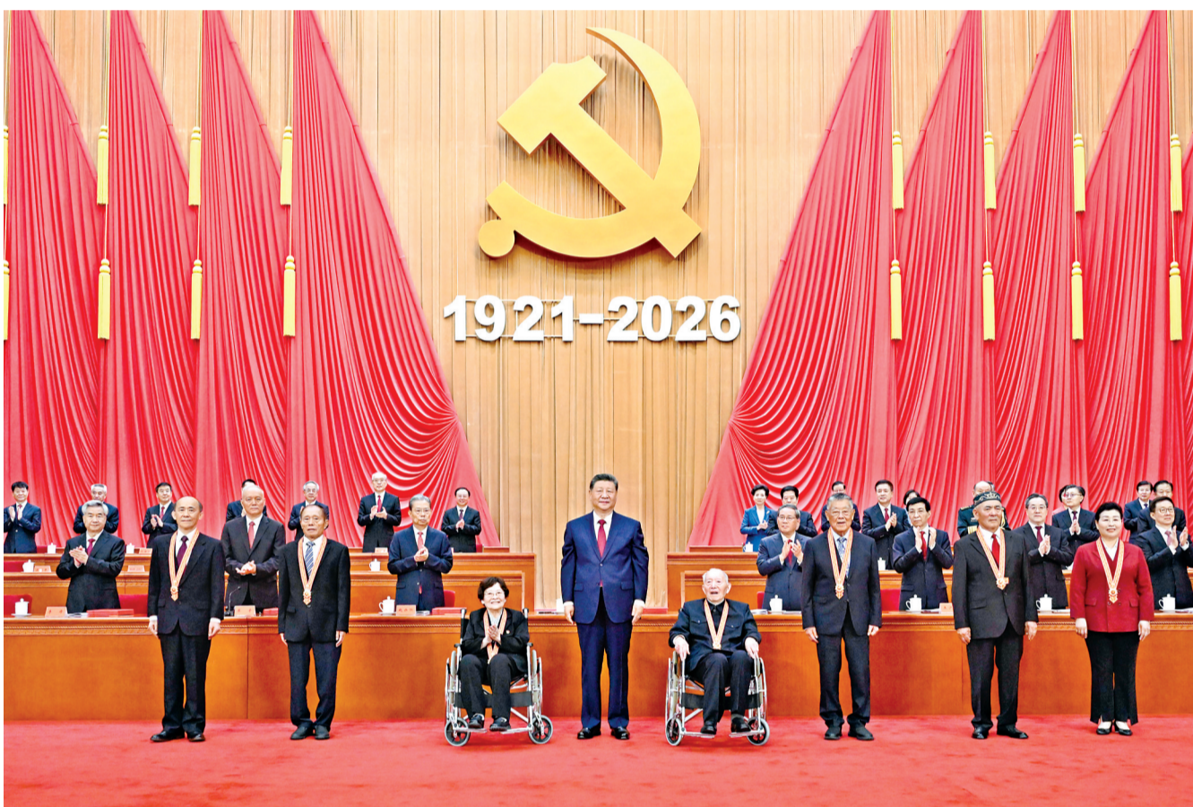
7月1日上午,庆祝中国共产党成立105周年大会在北京人民大会堂隆重举行。中共中央总书记、国家主席、中央军委主席习近平向“七一勋章”获得者颁授勋章。

新华社北京7月1日电 庆祝中国共产党成立105周年大会7月1日上午在北京人民大会堂隆重举行。中共中央总书记、国家主席、中央军委主席习近平向“七一勋章”获得者颁授勋章并发表重要讲话。他强调,105年来,我们党始终坚守为中国人民谋幸福、为中华民族谋复兴的初心使命,在不懈奋斗中创造了彪炳史册的伟大成就。新征程上,全党同志要坚定信心、接续奋斗,不断创造无愧于时代和人民的新业绩。