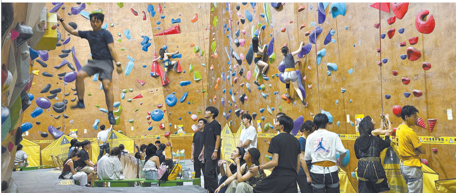
在亲橙万象攀岩馆,不少年轻人换上运动服,在五彩斑斓的岩壁上挥洒汗水。